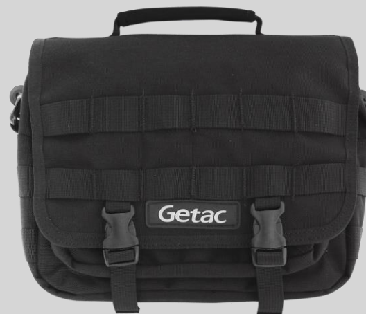
Foto del producto