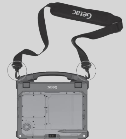
Anbringen an der abnehmbaren Tastatur