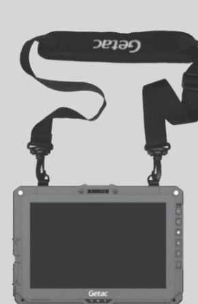
Anbringen an der Tablette